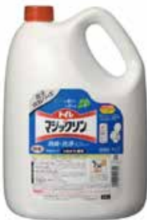
トイレマジックリン消臭 洗浄スプレー 4.5ℓ