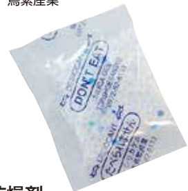
乾燥剤 シリカゲル SP-2g