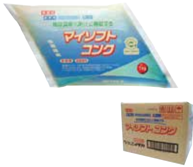
マイルドコンク(1kg×4袋)