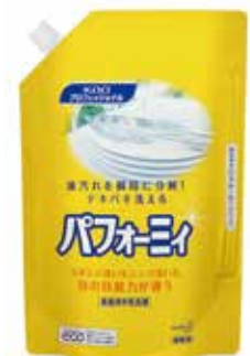
パフォーミー 2L パウチ