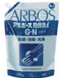
アルボース石けん液 iGN 1kg