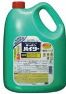
キッチンハイター 5kg