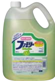
ファミリーフレッシュ 4.5ℓ