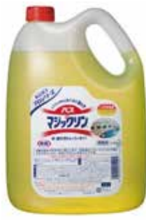
バスマジックリン 4.5ℓ