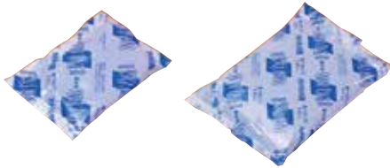
スノーパック 最少出荷単位 1個