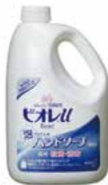
ビオレUハンドソープ 2ℓ