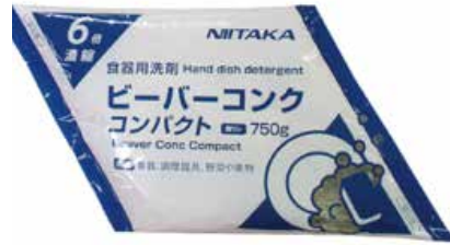
ビーバーコンク コンパクト(750g×4袋)