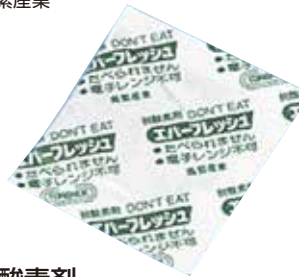
脱酸素剤 エバーフレッシュ QJ-30