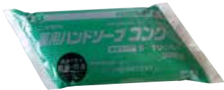
薬用ハンドソープコンク (500g×4袋)