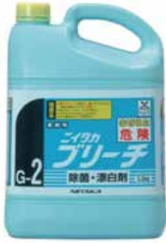
ニイタカブリーチ 5.5kg