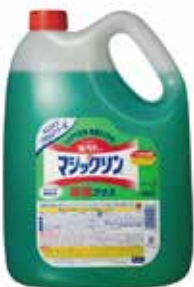
マジックリン除菌プラス 4.5ℓ