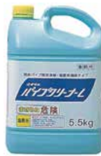
パイプクリーナーL 5.5kg