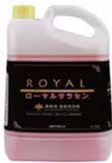
ローヤルサラセン 5kg