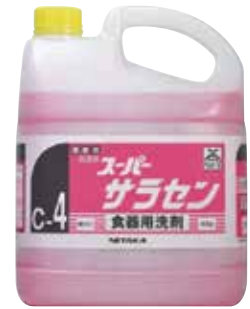
スーパーサラセン4kg