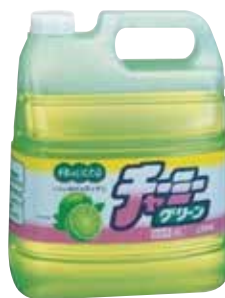
チャーミーグリーン 4ℓ