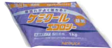
新)ケミカルエコロジー(個包装)