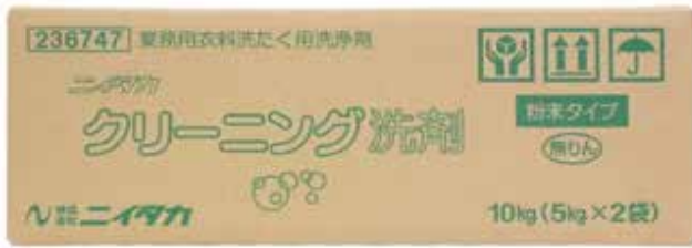
ニイタカクリーニング洗剤 5kg×2