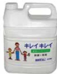
キレイキレイ 薬用ハンドソープ 4ℓ